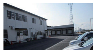
2015年9月 有隣グループ船橋センター開設