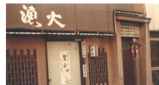
旧本社屋 1F 雀荘「漁火」は有隣商事が運営