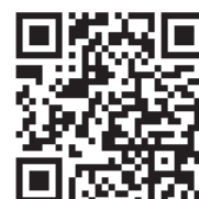
有隣グループ HP QRコード