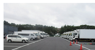
2017年6月 習志野車庫開設