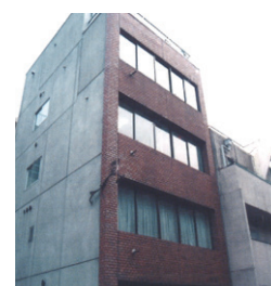
2代目となる旧・有隣ビル