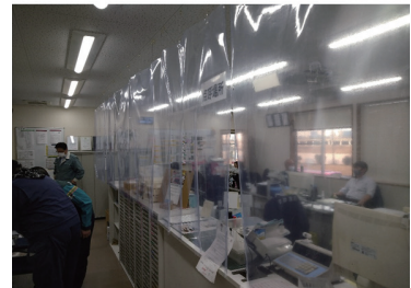
2020 年末 コロナ対策中の運送営業本部

また、2012 年 6 月新本社ビル落成、2014 年 4 月船橋統括本部（現運送営業本部）を開設するなど、ますます地域との連携を深めて有隣グループ全体でより安全で、確実な定温輸送の実現を日々努力しております。さらに、東京都トラック協会の推進するグリーンエコプロジェクトにも早くから参加し、車両ごとの燃費等を常に注視しエコドライブを心掛け、CO 2 の削減を目指してより環境に優しい運転を目指しています。